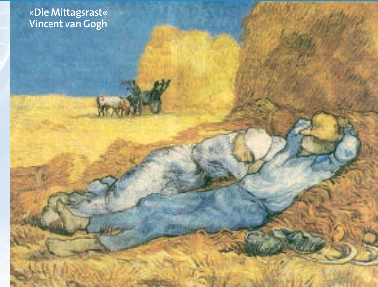
»Die Mittagsrast« Vincent van Gogh

Die Zertifizierung der Veranstaltung wurde bei der LÄK Brandenburg beantragt. Die Teilnahme ist kostenfrei.